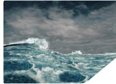
Meere und Küsten