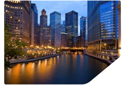
Städte und Industrie